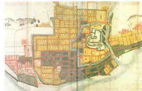
津山城下絵図 (享保8年 1723)