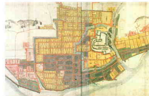
津山城下絵図(享保8年1723)