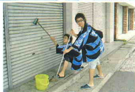
お掃除イベントの様子→ お掃除イベントは、10月23日(土)に開催!!

子どもたちに大人気のスタンプラリーを開催します!! 多くの若者と触れ合えるチャンスです(^o^)/各店舗にスタンプを配置するので、お兄さんやお姉さんにスタンプを押してもらって、景品をゲットしよう!!