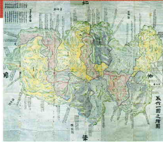
美作一国之絵図 (正保2年 1645)