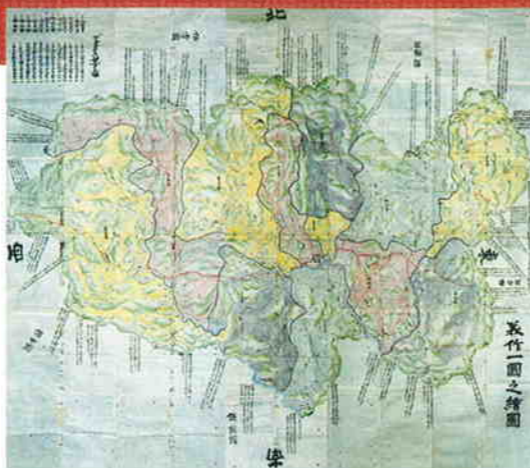
美作一国之絵図(正保2年1645)

減多にお目にかかれぬ縦2.72m×横3.18m大の絵図ほかを拝見し、城下町津山を読み解きましょう。