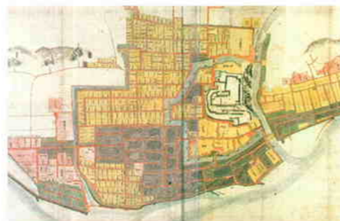
津山城下絵図(享保8年1723)